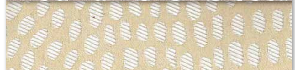
B Crème 32