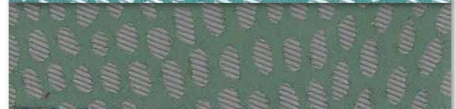
G Vert 24