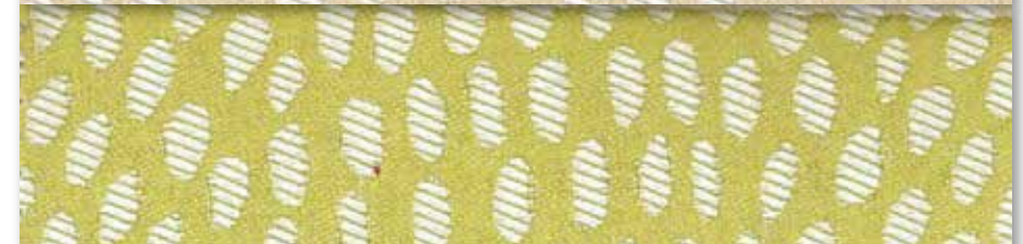
B Anis 62