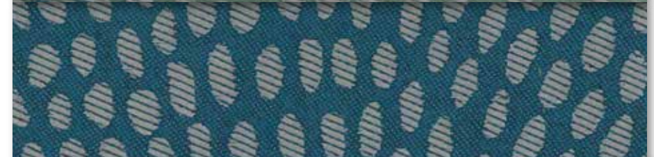
G Canard 80