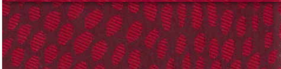
R Rubis 59