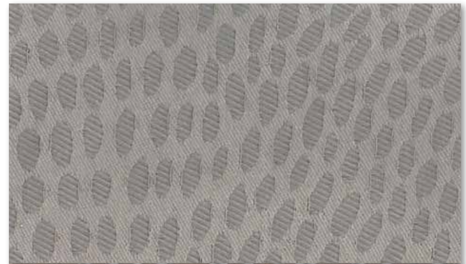
G Beige 63