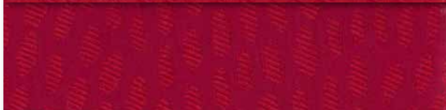
R Bordeaux 04