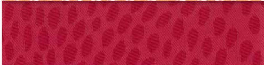
R Corail 14