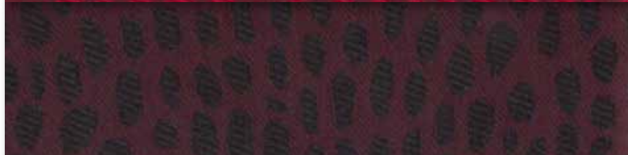
N Aubergine 27