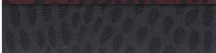
N Ardoise 87