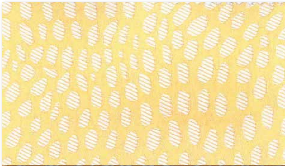
B Maïs 37