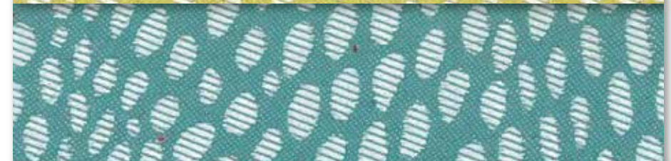
B Turquoise 53