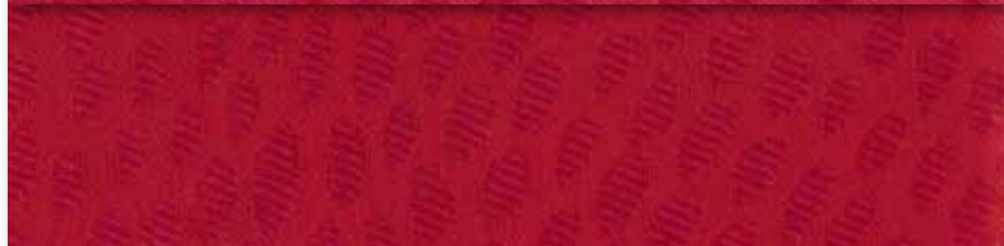
R Cuivre 50