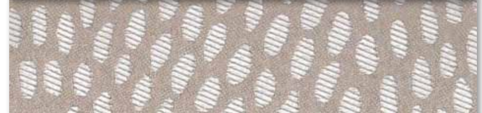
B Chanvre 72