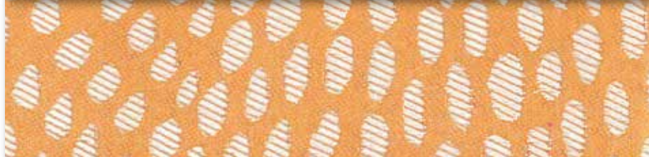
B Abricot 08