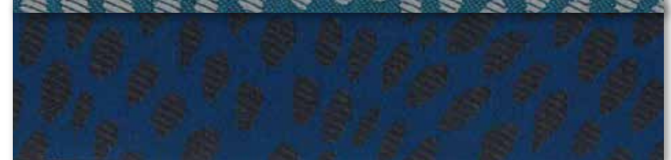
N Océan 91