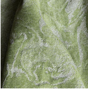
IMMERSION SIENTA Mousse 92