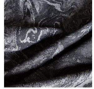
IMMERSION SIENTA Sisal 140