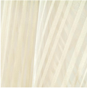
ORGA 10 RAYE VEGA Beige 63